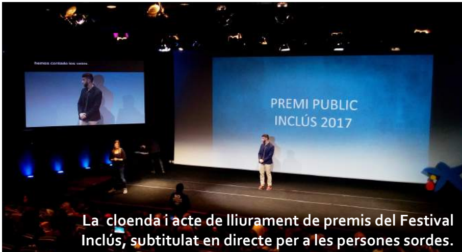
La cloenda i acte de lliurament de premis del Festival Inclús, subtitulat en directe per a les persones sordes.