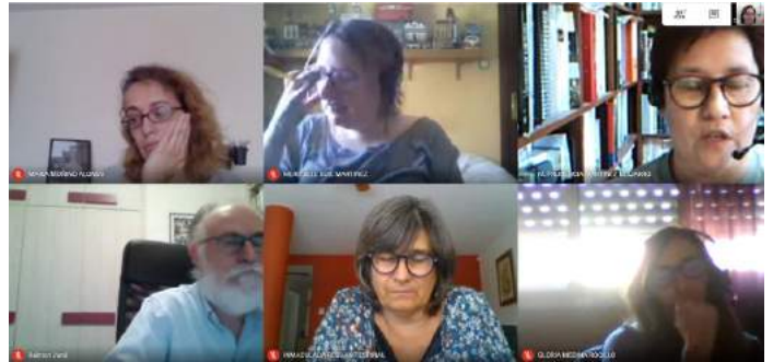
Reunió virtual amb el departament d'Educació, el 13 de maig

Pel que fa al proper curs 2020-21, encara no hi ha cap certesa de com serà la proposta definitiva d'escolarització. Això sí, serà adaptada a cada etapa educativa (infantil, primària, secundària i estudis post-obligatoris). Pel que fa al suport específic a l'alumnat amb sordesa, està prevista la contractació de nous professionals per als CREDA i la instal·lació de