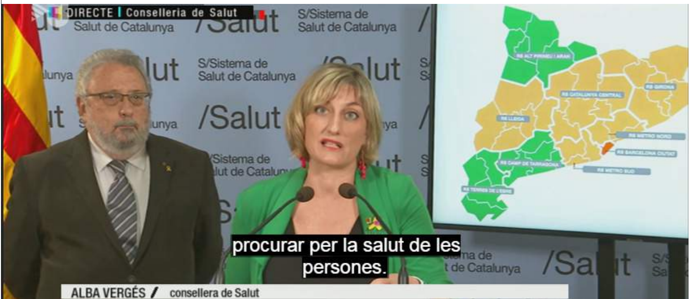
Televisió de Catalunya subtitula en directe les rodes de premsa del departament de Salut a petició de la Federació ACAPPS